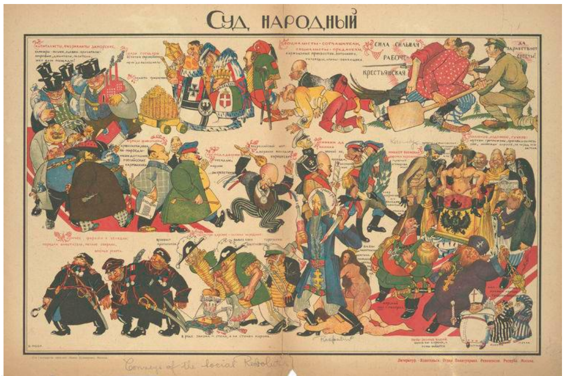
КИМ № 1.

Дать историческую характеристику данного агитационного плаката, следуя плану: